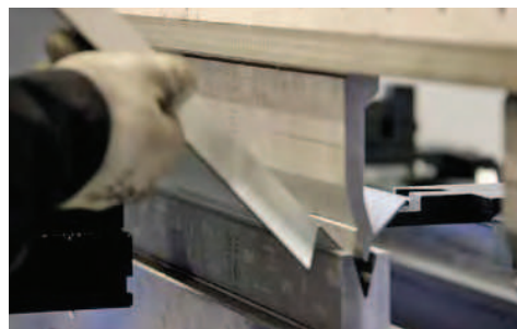
De productie vindt volledig in eigen huis plaats, waardoor Metaveld de kosten in de hand houdt

Tot die nieuwe markten behoort dus ook het Rhino-programma aanrijdbeveiligingen. "Vanuit mijn vorige functie merkte ik dat veiligheid bij een groeiend aantal bedrijven hoog in het vaandel staat. Dat zal, onder andere door strengere Arbo-wetgeving en machinerichtlijnen, in de toekomst alleen nog maar meer het geval zijn", vervolgt Van Voorden. Met de introductie van het programma beschermingsartikelen voor in en rond magazijnen en productieomgevingen geeft Metaveld invulling aan die groeiende vraag naar bescherming van personen, machines en goederen.